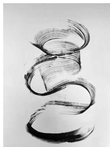
Número de obras: 4 Título: Aquíahora))) Técnica: Tinta china Soporte: Papel acuarela Dimensiones: 100 x 80 cm Año: 2026