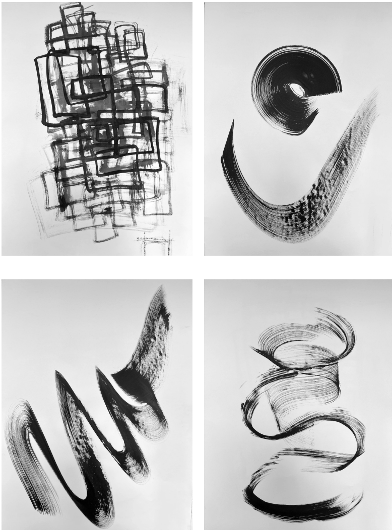
Figuras 6, 7, 8 y 9. Piezas 6-9.