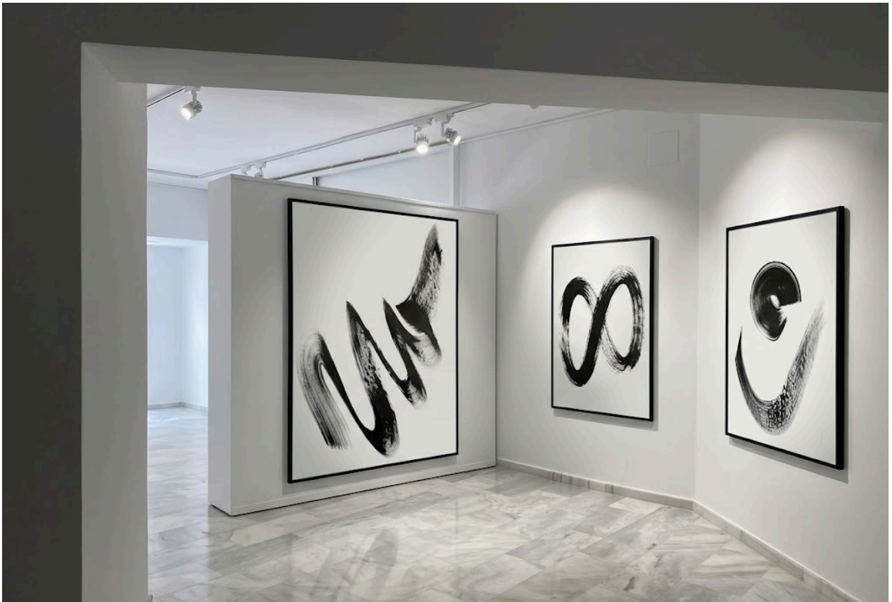
Figura 15. Recreación digital de una de las paredes con las obras.

Como complemento, se podría haber elaborado una maqueta a escala 1:50 con los paneles móviles repositionados, para comprobar el flujo de recorrido y la fragmentación del espacio central.