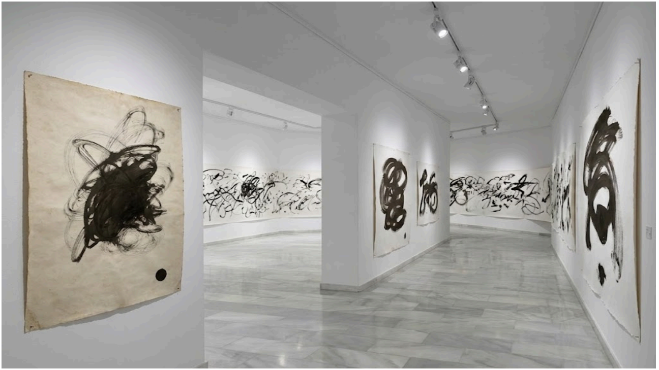
Figura 16. Recreación digital de la sala.