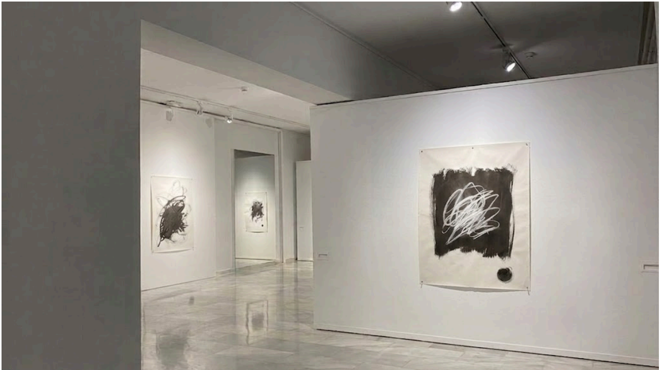
Figura 17. Recreación digital de la sala.