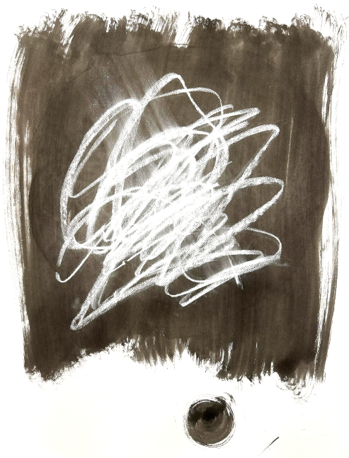
Figura 1. Pieza número 1.