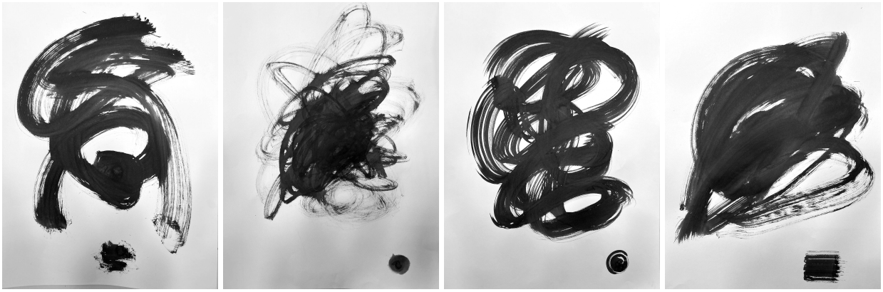
Figuras 2, 3, 4 y 5. Piezas 2-5.