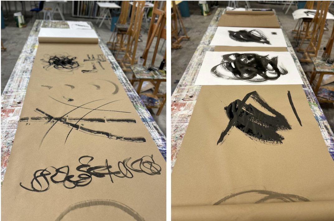
Figuras 10 y 11.

Aproximadamente 100 metros lineales de papel continuo. Se desplegarán en las paredes angulares y perimetrales. La altura superior del papel se sitúa a 1,66 m desde el suelo. La altura inferior varía según la anchura del rollo (entre 40 cm y 100 cm).