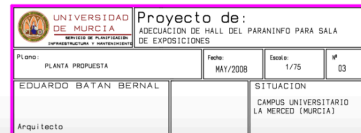
Figura 13. Plano de la sala.